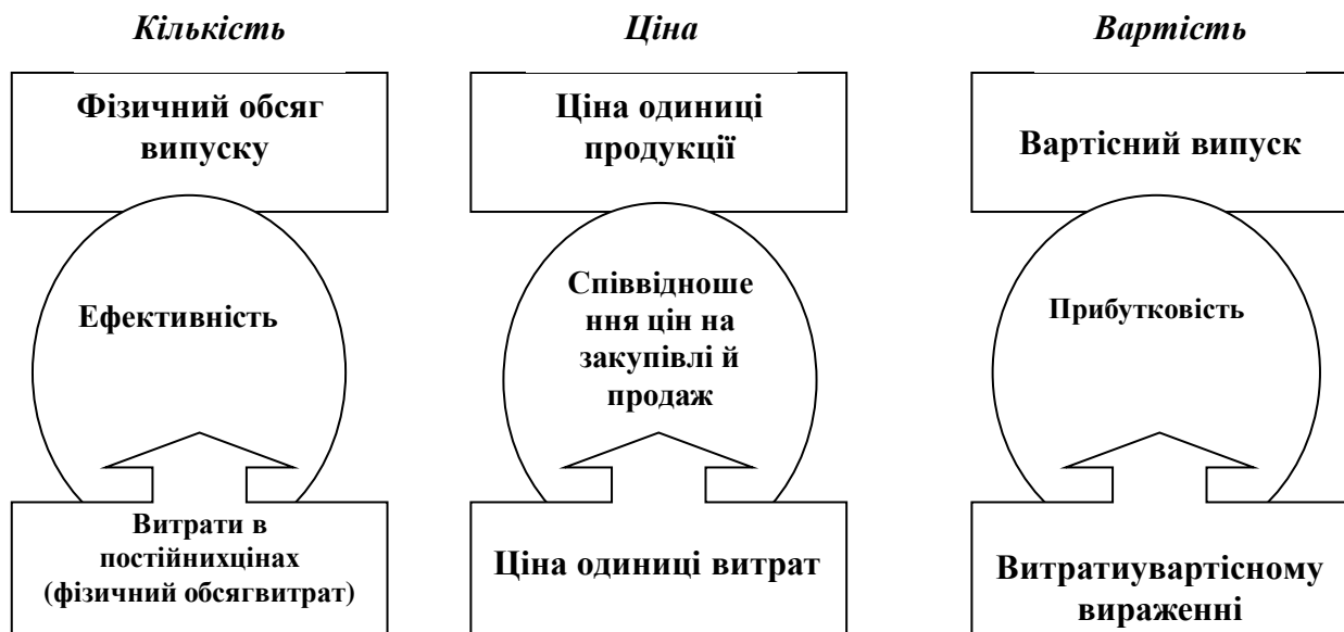
Рис. 2. Фактори, що впливають на зміну якісних показників діяльності економічної системи

Співвідношення між основними показниками ефективності впливає зі значенневого факторного співвідношення, представленого на рис. 2.