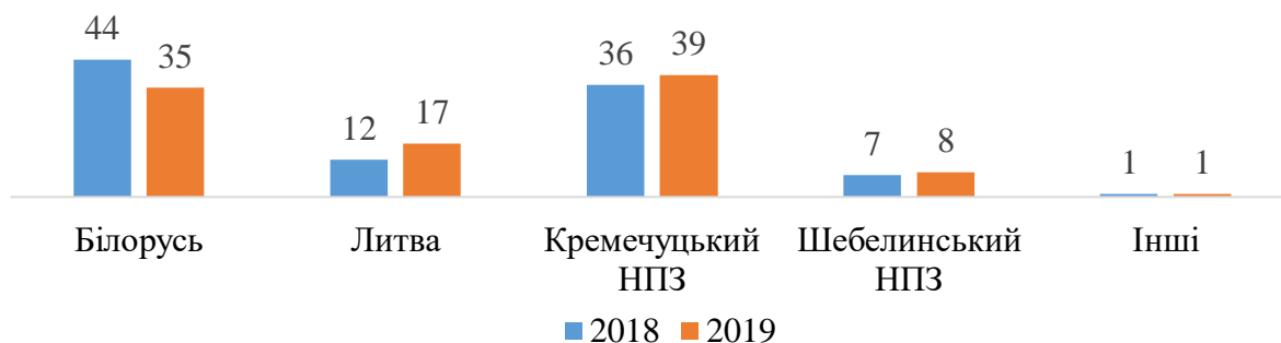
Рис. 1. Структура поставок бензинів на ринок України, % побудовано авторами за даними [10]

У 2019 році, за даними Enkorr, виробництво бензинів українськими НПЗ збільшилося на 10% до 908 тис. т, що дозволило вітчизняним підприємствам підвищити на 4% свою частку на ринку.